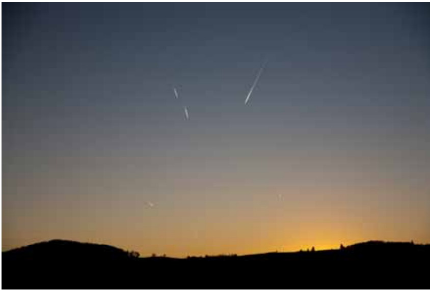
Ruée vers l'Ouest . Les avions se rassemblent sur les Monts du Lyonnais pour rattraper le soleil. Ludovic d'Anchald