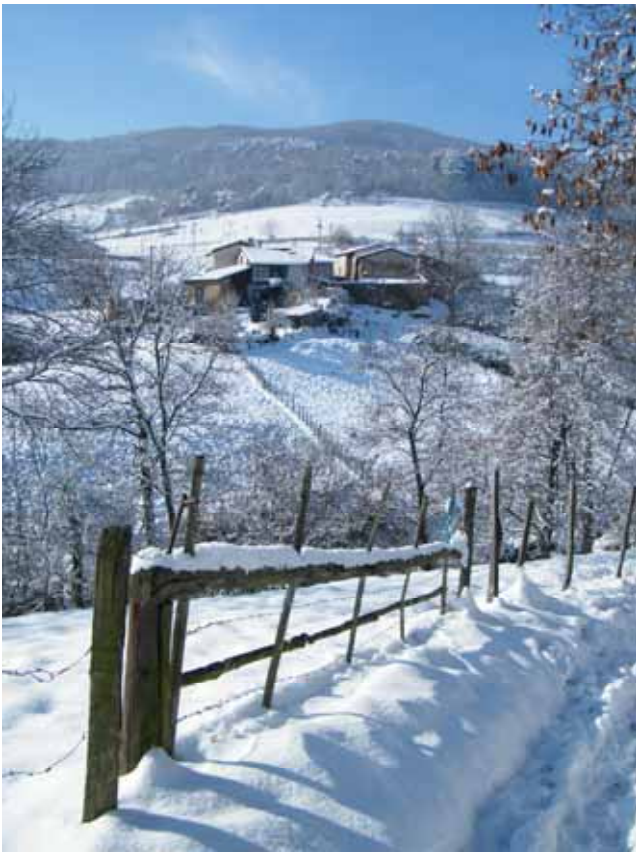
Paysage de neige - Vaugneray Geneviève Hector