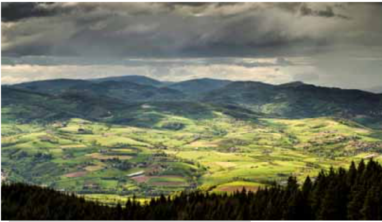
Ombres et lumière - Col de la Luère Emmanuel Le Guellec