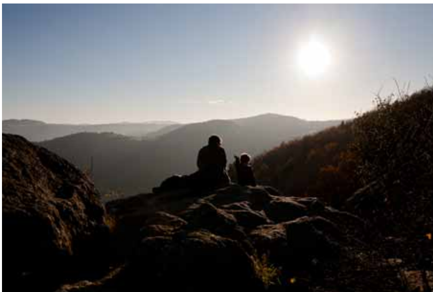
Here goes the sun Ludovic d'Anchald - 3eme prix