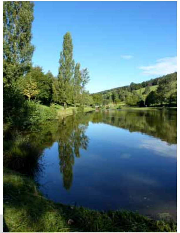
Harmonie des reflets sur le lac, jeu d'équilibre - Yzeron Aïcha Vésin Chérif