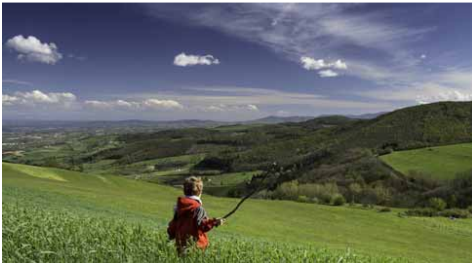
A l'assaut des Vallons Emmanuel Le Guellec - 2eme prix