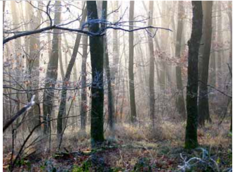
La magie des sous bois dans les coteaux du Lyonnais - Pollionnay Antonio Gonzalez