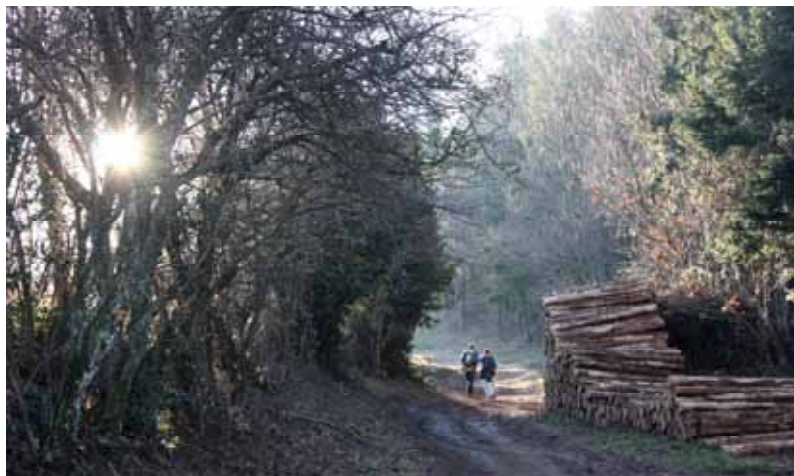
Miroir mon beau miroir - Yzeron Emmanuel Le Guellec